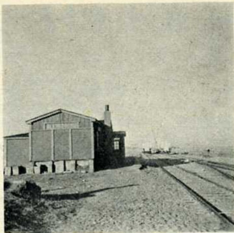
Hirtshals – station 2.

Senere leverede vogne fra Scandia sidst i 1920'erne gav ikke disse kvaler.