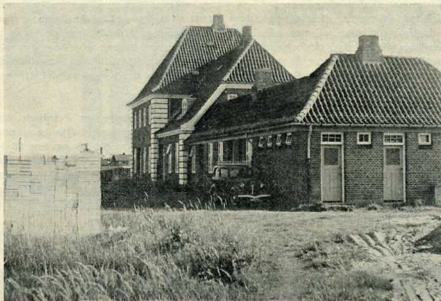
Hirtshals – station 1, fotograferet i 1963.