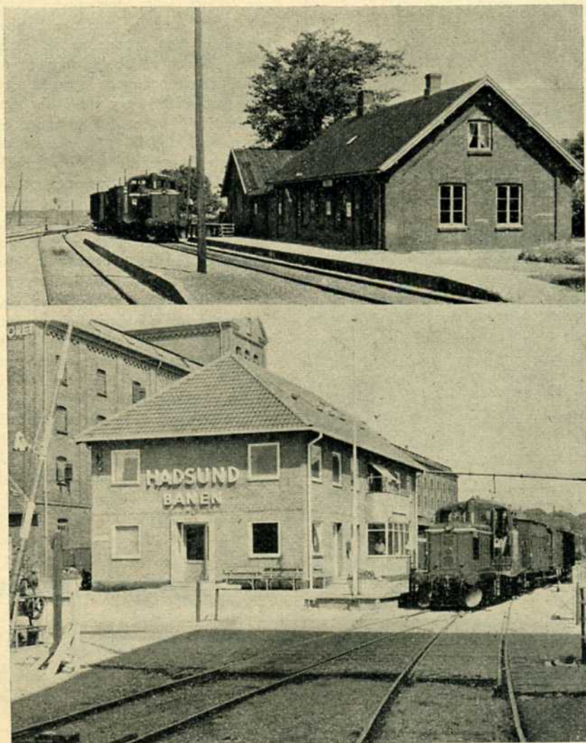
Øverst: Gerlev station. Nederst: Randers Privatbanestation

Som følge af dampmotorvognenes utilstrækkelighed måtte banen i 1892 og 1898 anskaffe 2 små tokoblede damplokomotiver, som i 1905 suppleredes med en brugt