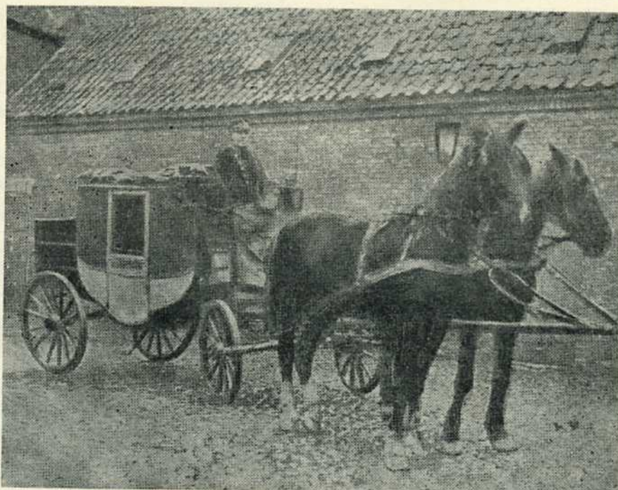
Diligencen Fjerritslev-Thisted med post-Søren på bukken

Gennem århundreder var Nordjylland egnen Norden for lov og ret. Alfarvejen snoede sig gennem øde egne og knyttede de spredte byer og bebyggelser sammen med et spinkelt bånd. En så afsides provins som Nordjylland måtte for færdselsvejenes vedkommende blive et stedbarn, og ustandselig klagedes der da også over vejenes slette tilstand. De hjalp lidt, da vejen op gennem Hanherred omkring 1850 blev chausseret, men helt fin har den næppe været, for saa sent som 1890 kunne man i Aalborg