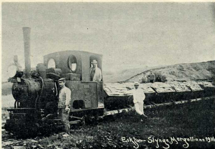
Eskjær-Slyng Mergelbanes damplokomotiv, Krause 3446/1897, fotograferet i 1916, ikke med mergeltog, men med en last mursten.

31/5 1896. Vedtages at købe lyng billigst muligt for at overdækkebanele-