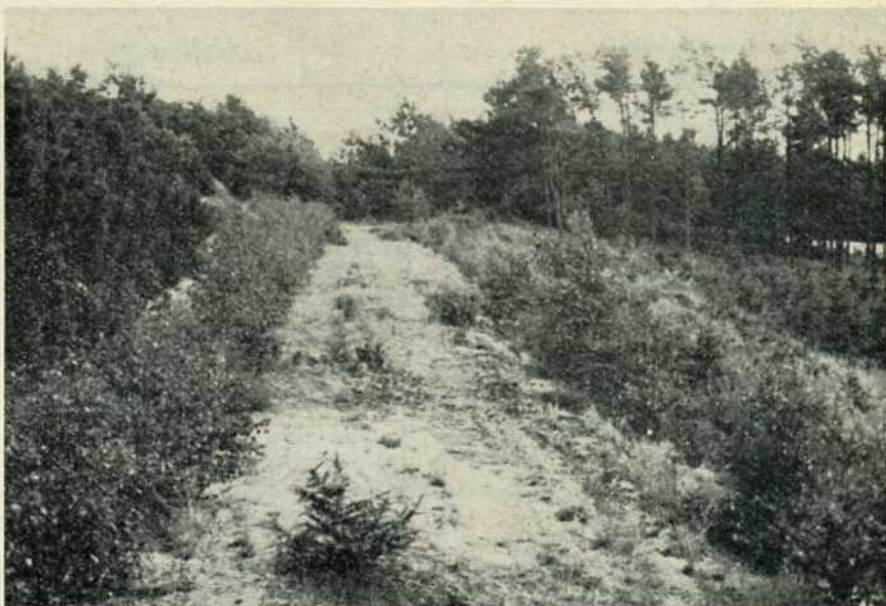
Banerest SV for Tirstrup by