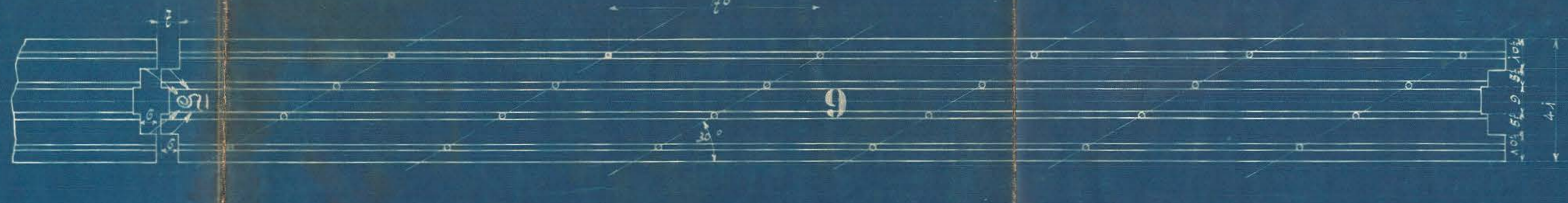
Fuge wenn Richtungsring entspannt.